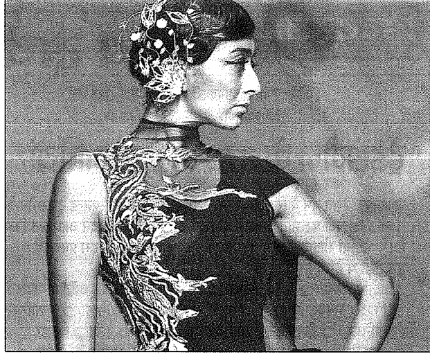
कोतूर संग्रह पहने रैंप पर कैटवॉक करती एक मॉडल।